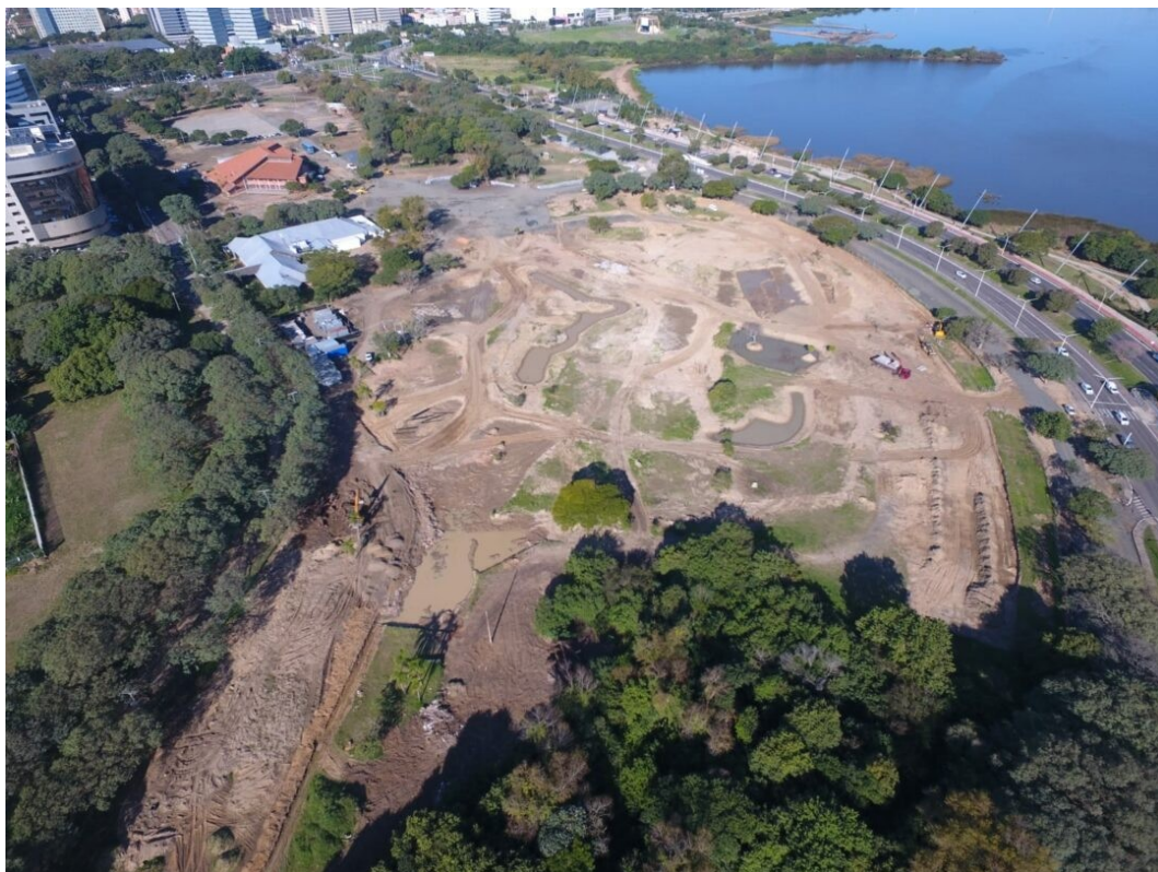
Parque da Harmonia após concessão e intervenções da GAM3 Parks por Gabriel Poester.