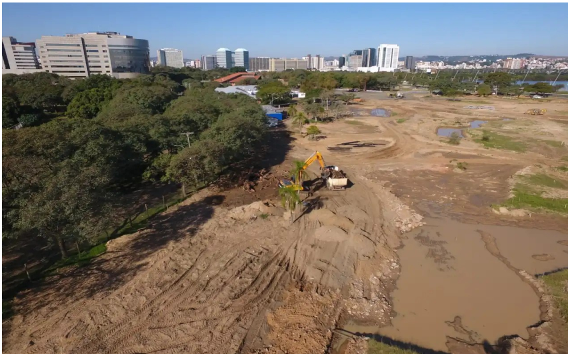
Parque da Harmonia após concessão e intervenções da GAM3 Parks por Gabriel Poester.

Contamos com teu apoio para lutar pela preservação do Parque da Harmonia, valorizando as áreas e parques públicos como espaços de qualidade ambiental para todas as formas de vida e para usufruto de toda coletividade. Considere não participar do Festival Turá no Parque Harmonia! Ficaremos muito felizes com a sua presença em nossa cidade como um aliado na defesa pela integridade dos nossos parques, praças e espaços públicos!